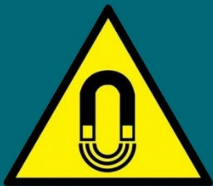
Campo magnético intenso