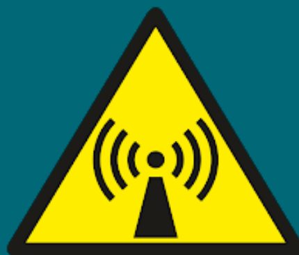
Campo de alta frecuencia